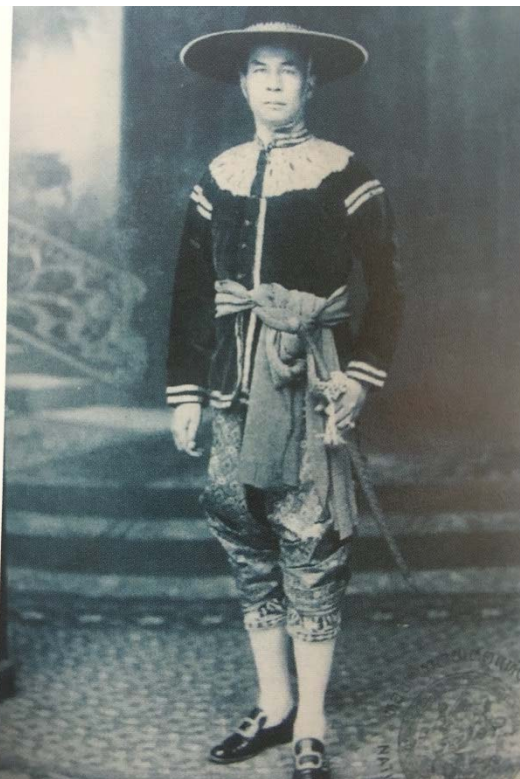
การแต่งกาย โจงกระเบน ในครั้งเป็นสยามประเทศ