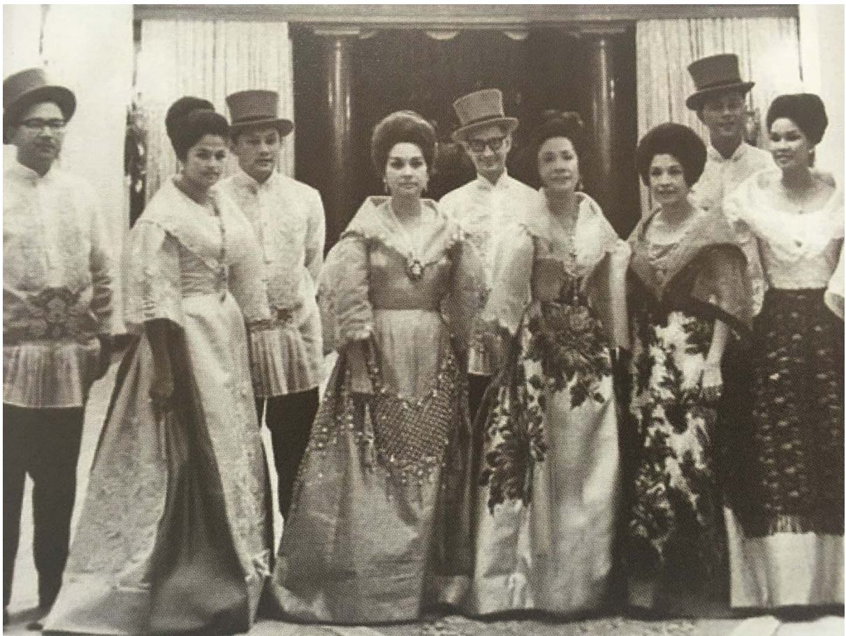
การแต่งกาย บุษบ - สตรี ประเทศฟิลิปปินส์