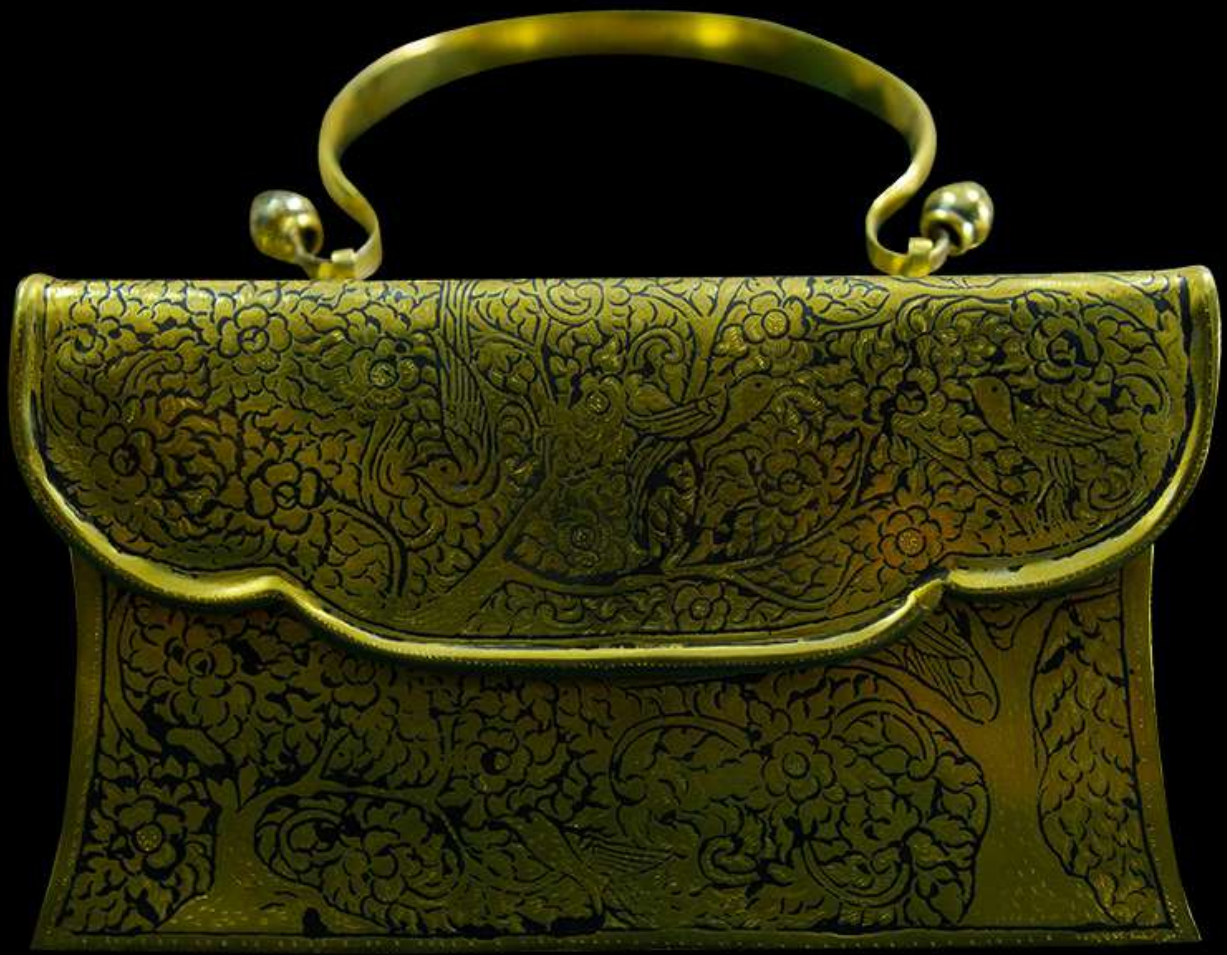
กระเป๋าดมทอง