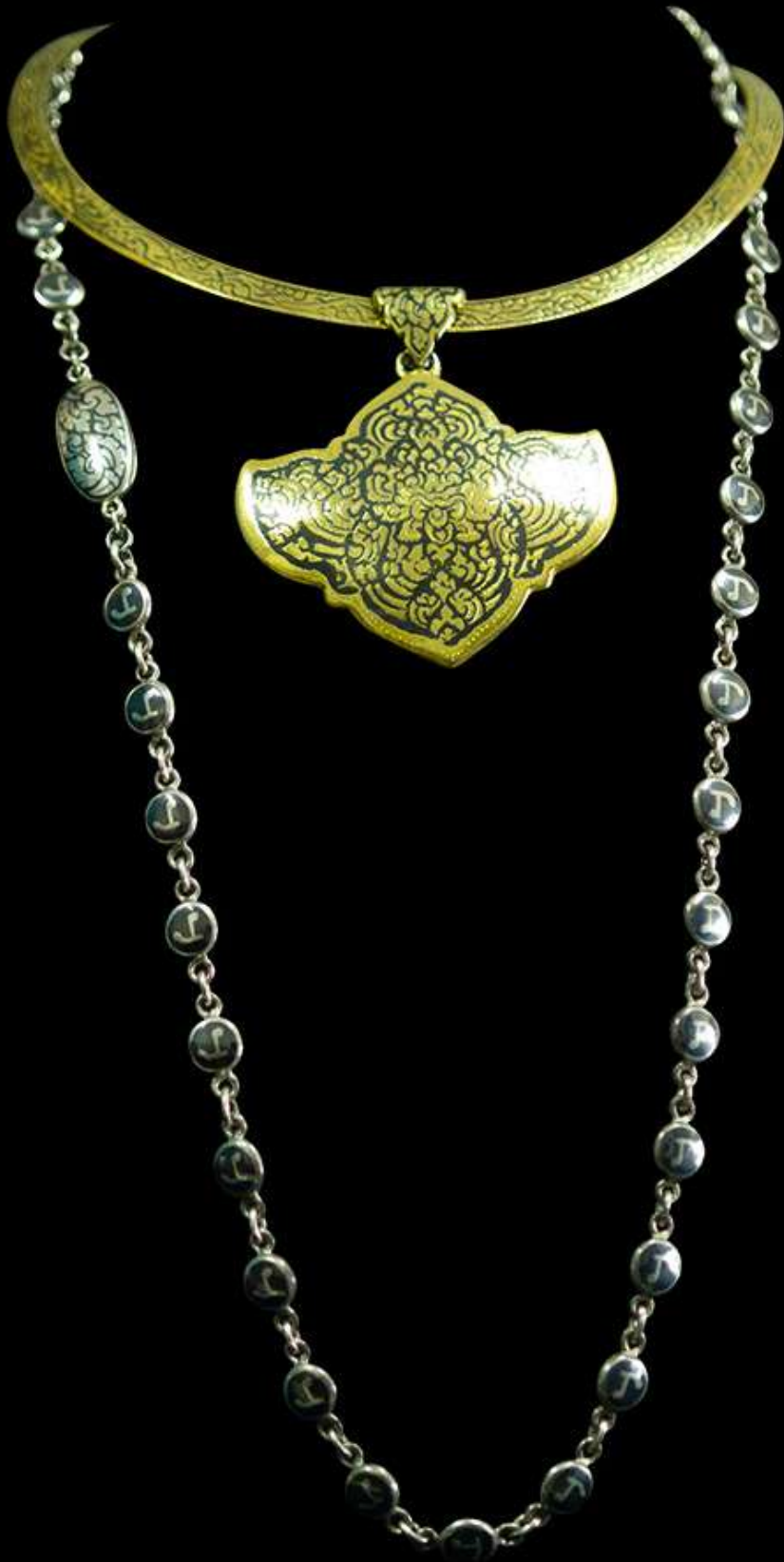
สร้อยคอถมทอง และสร้อยนะโม