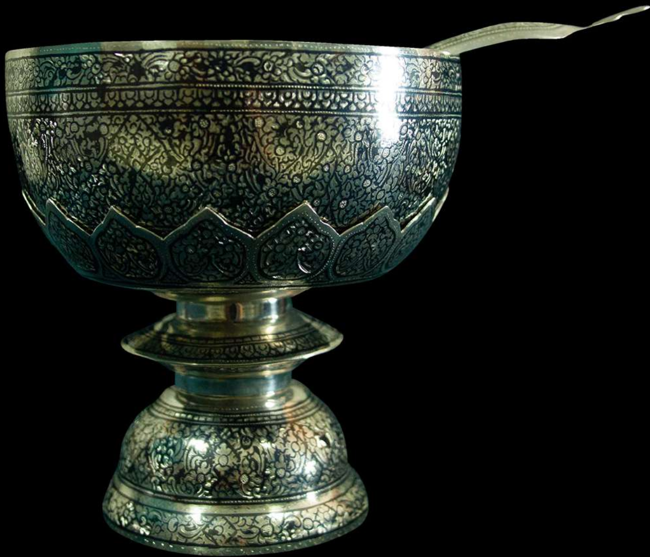
ชุดขันตมเงิน