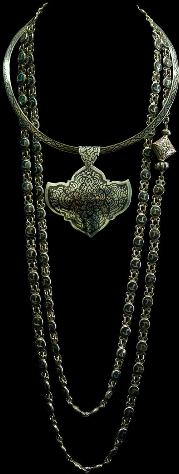
สร้อยคอถมเงิน และสร้อยนะโม