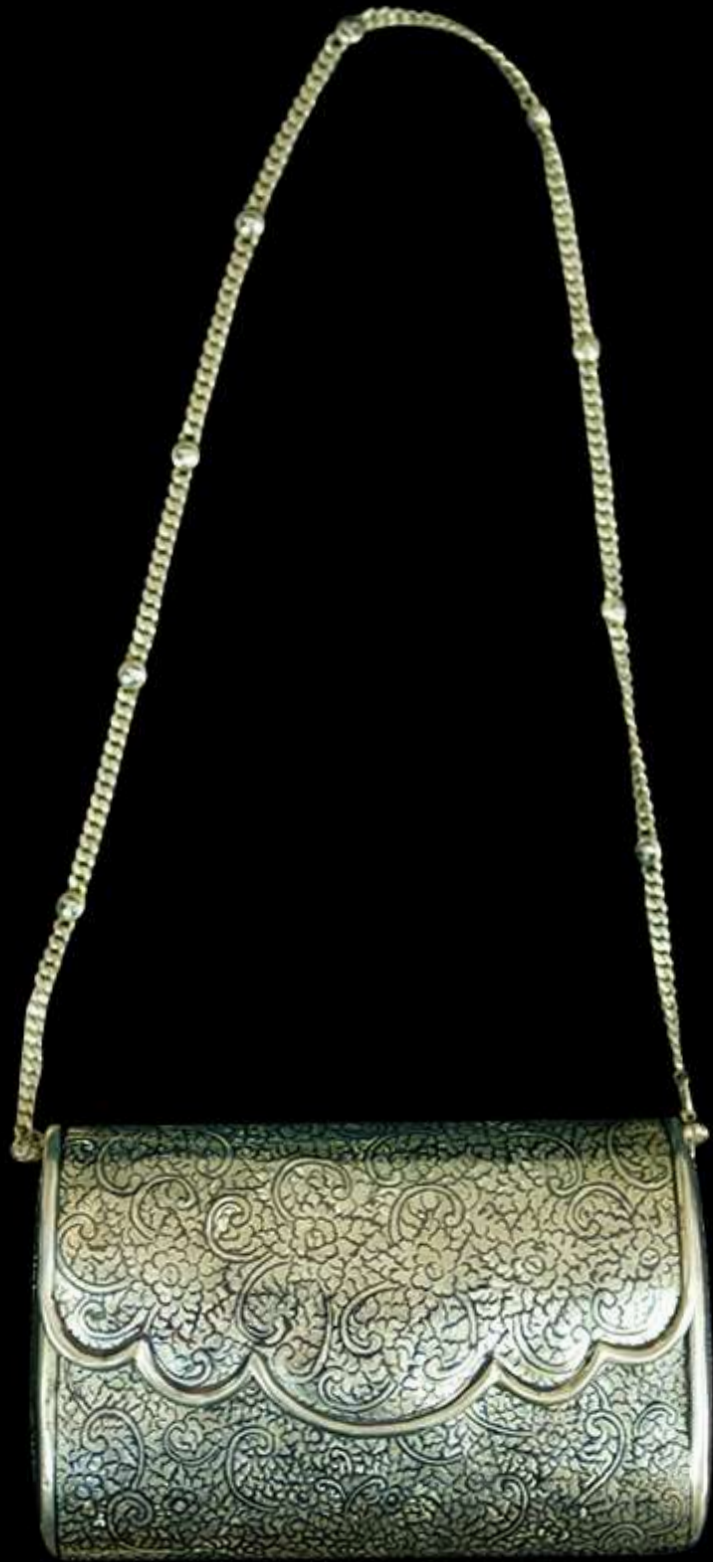
กระเป๋าทอมเงิน