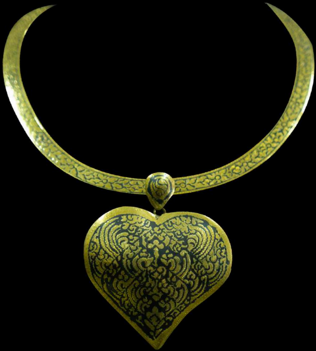
สร้อยคอถมทอง