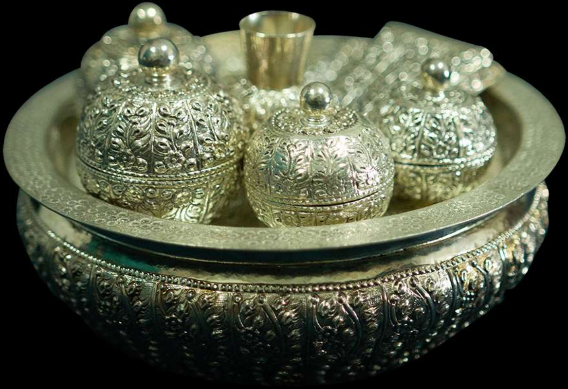
ชุดพานขันหมาก