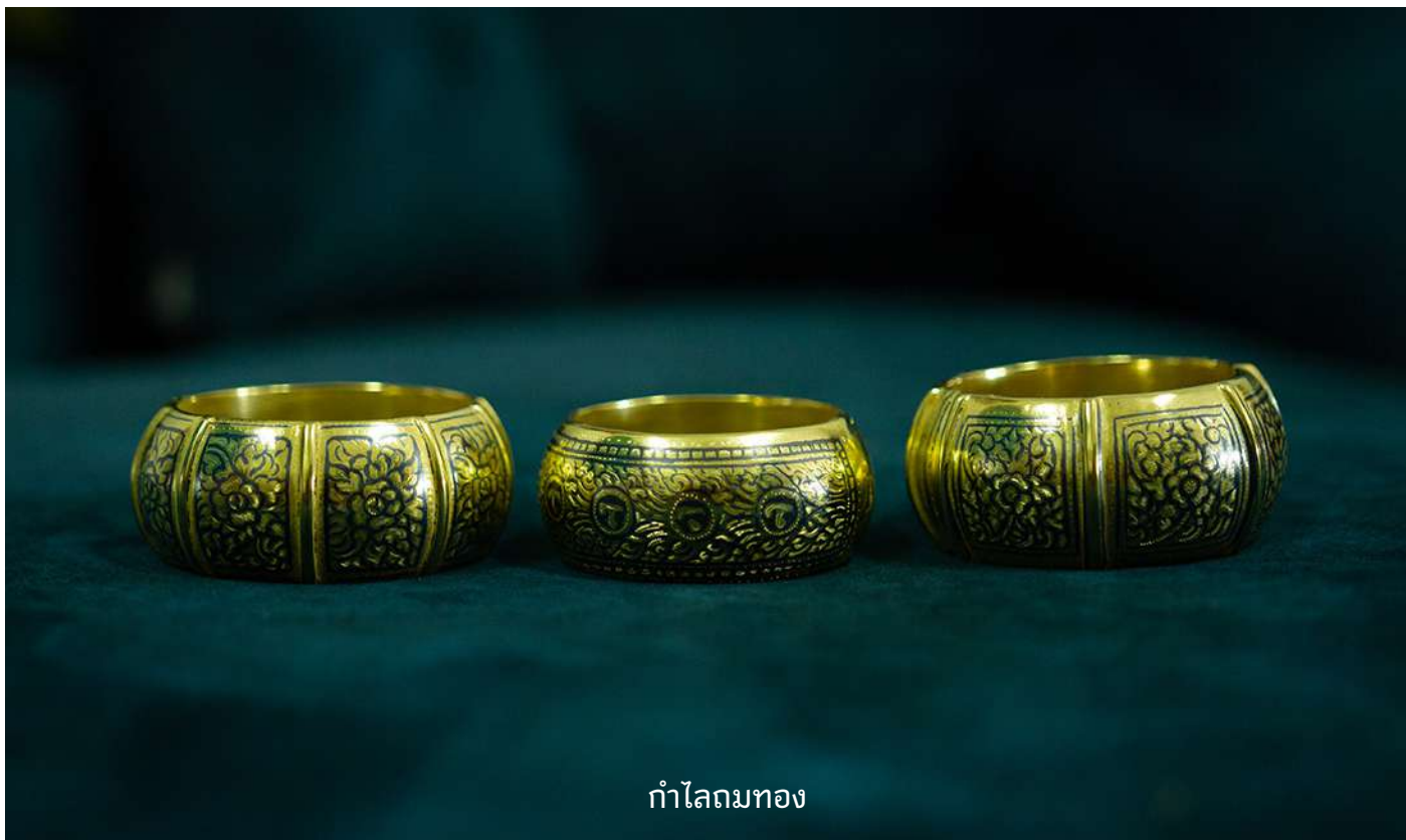
กำไลมทอง