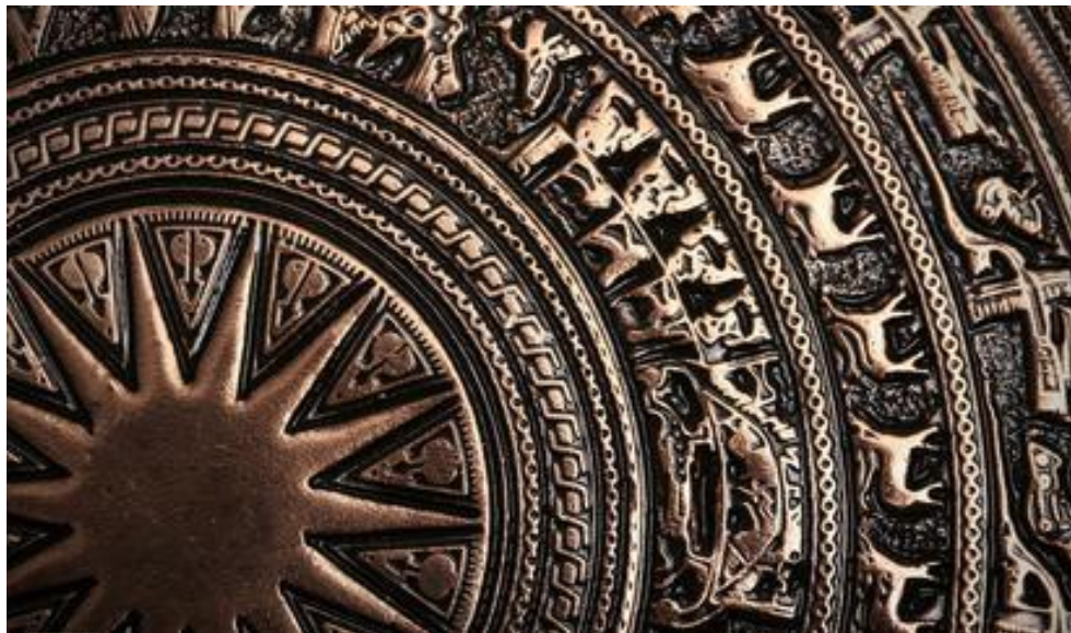
รายละเอียดลวดลายกลองสำริดทองซอน