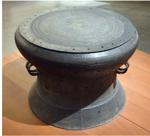
กลองสำริดทองซอน ลายดาวแปดแฉก

บนหน้ากลองสำริดทองซอน (ทั้งกลองยุคแรกๆ และยุคหลัง) จะพบดาวหลายๆ แฉกอยู่ตรงจุดศูนย์กลางที่ถ้าพุ่งเหยียน นักโบราณคดีได้พบเครื่องปั้นดินเผาและลูกดิ่ง ซึ่งมีลวดลายตกแต่งรูปดาวหลายแฉกเหมือนกัน การค้นพบทางโบราณคดีนี้พิสูจน์ได้ว่า การปรากฏลวดลายดาวหลายแฉกบนกลองสำริดทองซอน และในการออกแบบลวดลายทั่วไปของกลุ่มคนไทไม่ใช่เป็นผลที่ปรากฏขึ้นภายหลังจากการรับอิทธิพลของวัฒนธรรมอื่น แต่นี่คือลายที่มีจุดกำเนิดมาตั้งแต่ดั้งเดิม ในการออกแบบของคนไทลวดลายแปดแฉกมักจะปรากฏอยู่บนเส้นของดาวทรงมุมของกลองและมีวงกลมซ้อนๆ กันล้อมรอบ