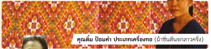
คุณติ่ม ป้อมคำ ประเภทเครื่องทอ (ผ้าซิ่นตีนจกลาวครึ่ง)