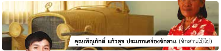
คุณเพ็ญภักดี แก้วสุข ประเภทเครื่องจักสาน (จักสานไม้ไผ่)