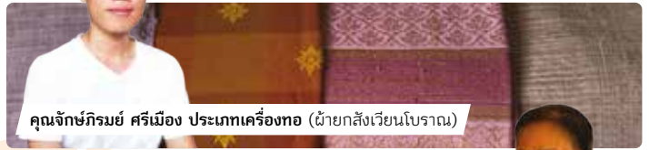
คุณจัทธีรathy ศรีเมือง ประเภทเครื่องทอ (ผ้ายกสังเวียนโบราณ)