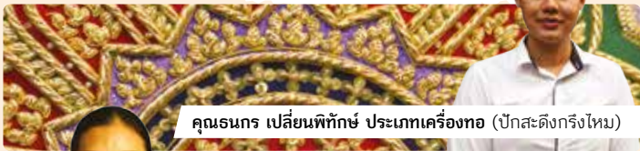
คุณอนกร เปลี่ยนพิทักษ์ ประเภทเครื่องทอ (ปักเสดิงกริงใหม่)