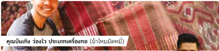
คุณบันเทิง ว่องไว ประเภทเครื่องทอ (ผ้าไหมมัดหมี่)