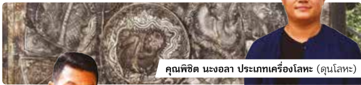
คุณพิชิต นงอลา ประเภทเครื่องโลหะ (คุณโลหะ)