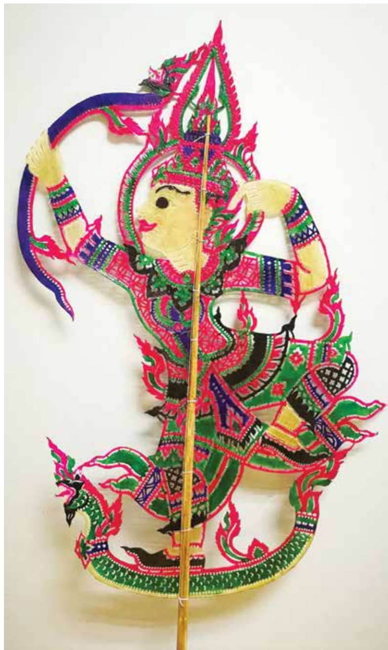
资料来源和参考的资料 资料来自 suan nudla师傅, kid kodrat师傅