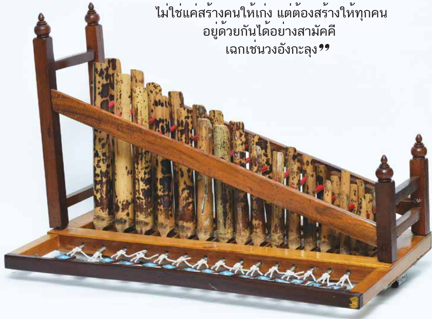
อังกะลุงราว แบบแป้นกด

“หัวใจของการสร้างงานให้สำเร็จ ไม่ใช่แค่สร้างคนให้เก่ง แต่ต้องสร้างให้ทุกคน อยู่ด้วยกันได้อย่างสามัคคี เลิกเซ่นวงอังกะลุง”