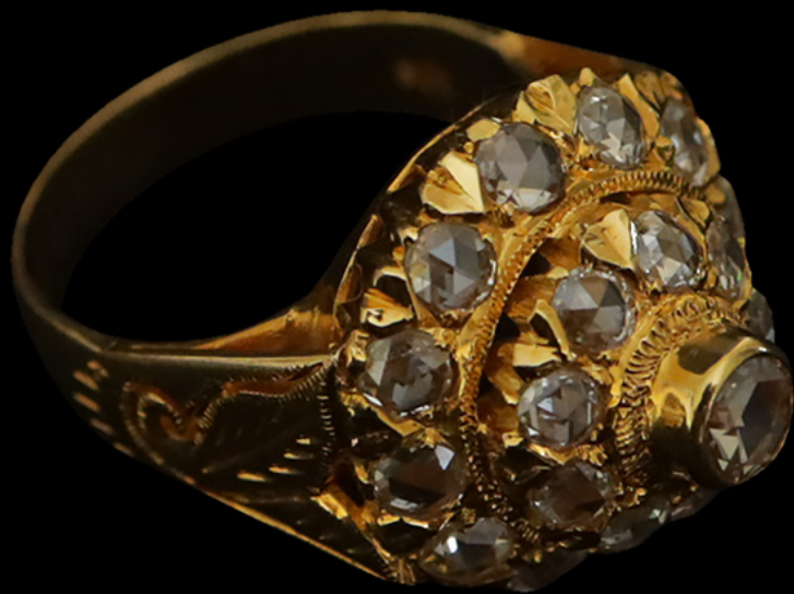
แหวนทรงมณฑป