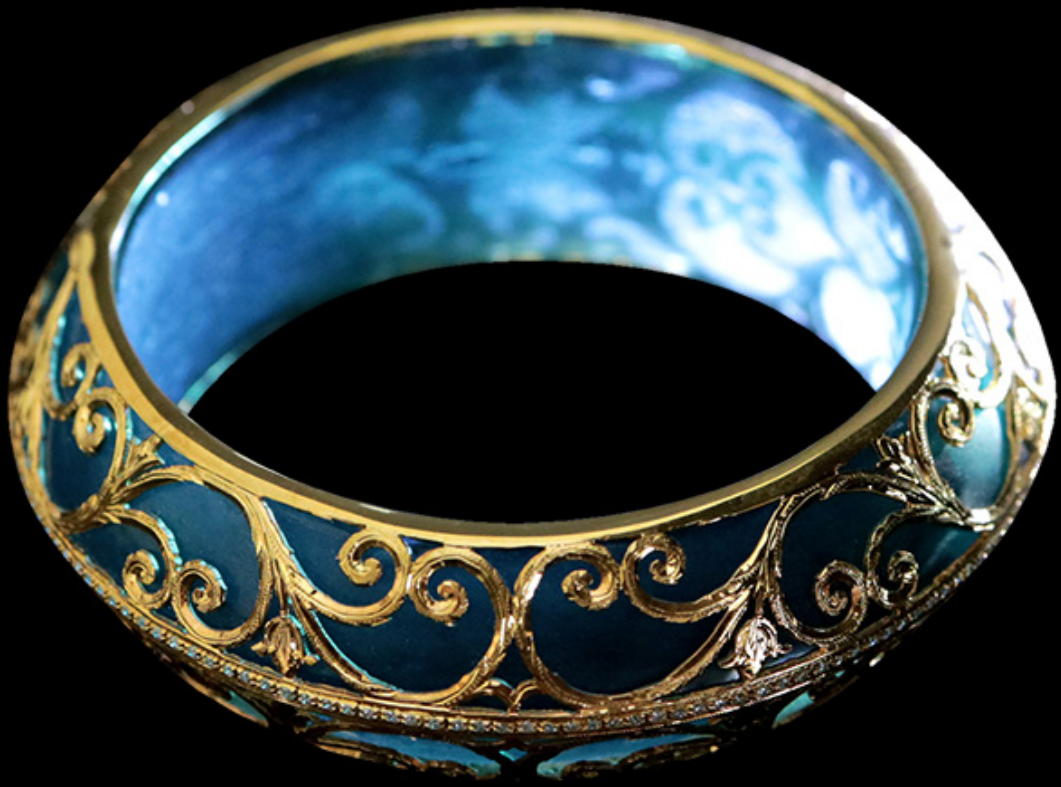
กำไลทองประดับหิน