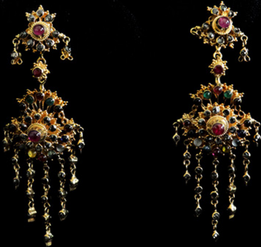
ต่างหูทองโบราณ