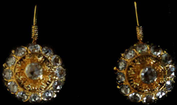
ต่างหูทองโบราณ