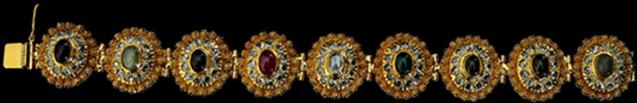
สร้อยข้อมือทองโบราณ

“เครื่องทองโบราณ” เป็นผลงานศิลปะที่สะท้อนให้เห็นถึงภูมิปัญญาของคนสมัยก่อน ที่นำทองมาสร้างสรรค์เป็นเครื่องประดับจนกลายเป็นเอกลักษณ์หนึ่งของชาติไทยที่มีมาอย่างยาวนานผ่านกระบวนการสร้างสรรค์อย่าง การดุน การหุ้ม การบุ การหล่อ การสลัก และการคร่ำ จนกลายเป็นผลงานที่บ่งบอกถึงคุณค่าของประวัติศาสตร์และศิลปวัฒนธรรมของชาติได้เป็นอย่างดี เครื่องประดับทองโบราณที่เกิดจากการสร้างสรรค์ของช่างฝีมือ เช่น สร้อยคอ สร้อยข้อมือ กำไล ต่างหู แหวน ปิ่นปักผม จี้ เข็มกลัด เป็นต้น