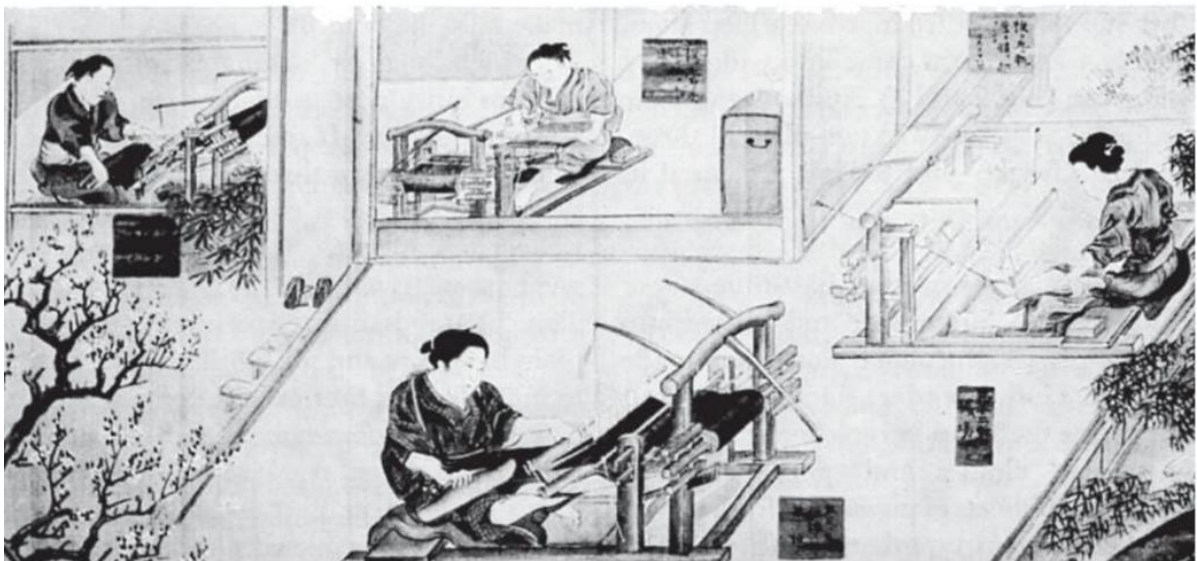
การทอผ้าของชาวญี่ปุ่น ด้วยเครื่องทอผ้าแบบกึ่งก๊อว (Backstrap frame loom)