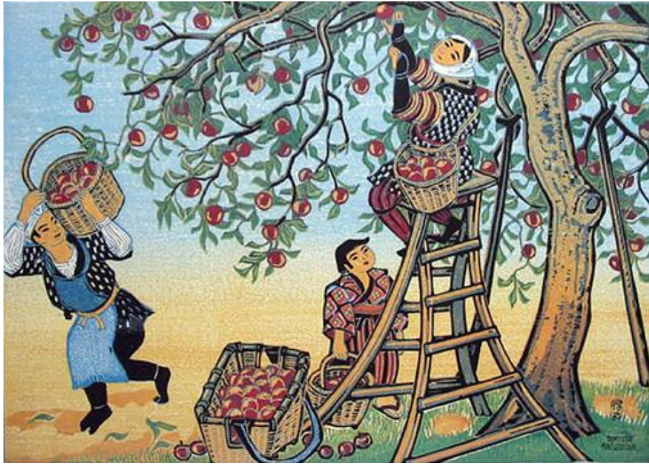
ภาพพิมพ์ของ Katsuhira Tokushi ในช่วงคริสต์ทศวรรษ 1940 แสดงการแต่งกายด้วยผ้ากาซึอริใน ชีวิตประจำวัน ของชาวญี่ปุ่น