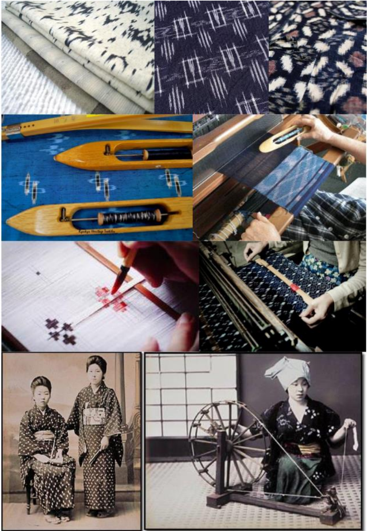
การแต่งกายในชุดกิโมโนที่ตัดเย็บด้วยผ้ากาซึอริ ของสตรีชาวญี่ปุ่น