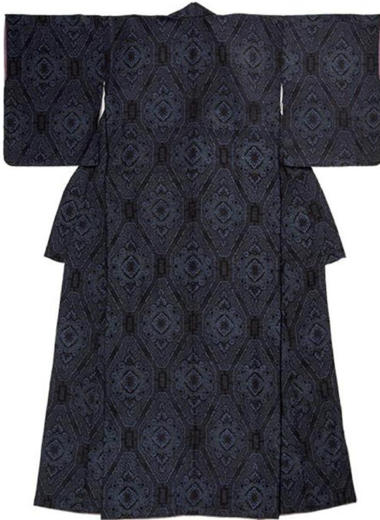
ชุกิโมโน ตัดเย็บจากผ้ากาซ็อริ

ในศตวรรษที่ 18 ถือว่าเป็นยุคทองของผ้ามัดหมี่กาซ็อริ จากสิ่งทอในครัวเรือนที่ทุกบ้านทำขึ้นใช้เองเริ่มมีการทำไรฝ้าย สร้างโรงย้อม และโรงทอผ้ากาซ็อริเพื่อการจัดจำหน่ายค้าขายออกไปทั่วทั้งประเทศญี่ปุ่นจนกระทั่งประเทศญี่ปุ่นประกาศเข้าร่วมสงครามโลกครั้งที่ 2 ทำให้การเกษตรกรรมและหัตถกรรมซบเซาลงส่งผลทำให้ปัจจุบันนี้ไม่มีการทอผ้าในแหล่งเดิมแล้ว เหลือเพียงช่างทอในพื้นที่ไม่กี่คนกับช่างฝีมือร่วมสมัยที่ร่วมกันอนุรักษ์และทอผ้ากาซ็อริแบบวิธีการดั้งเดิมทำให้ผ้ากาซ็อริเป็นสินค้าหายากทรงคุณค่า และราคาแพงชนิดหนึ่งในหัตถกรรมของญี่ปุ่นในปัจจุบัน