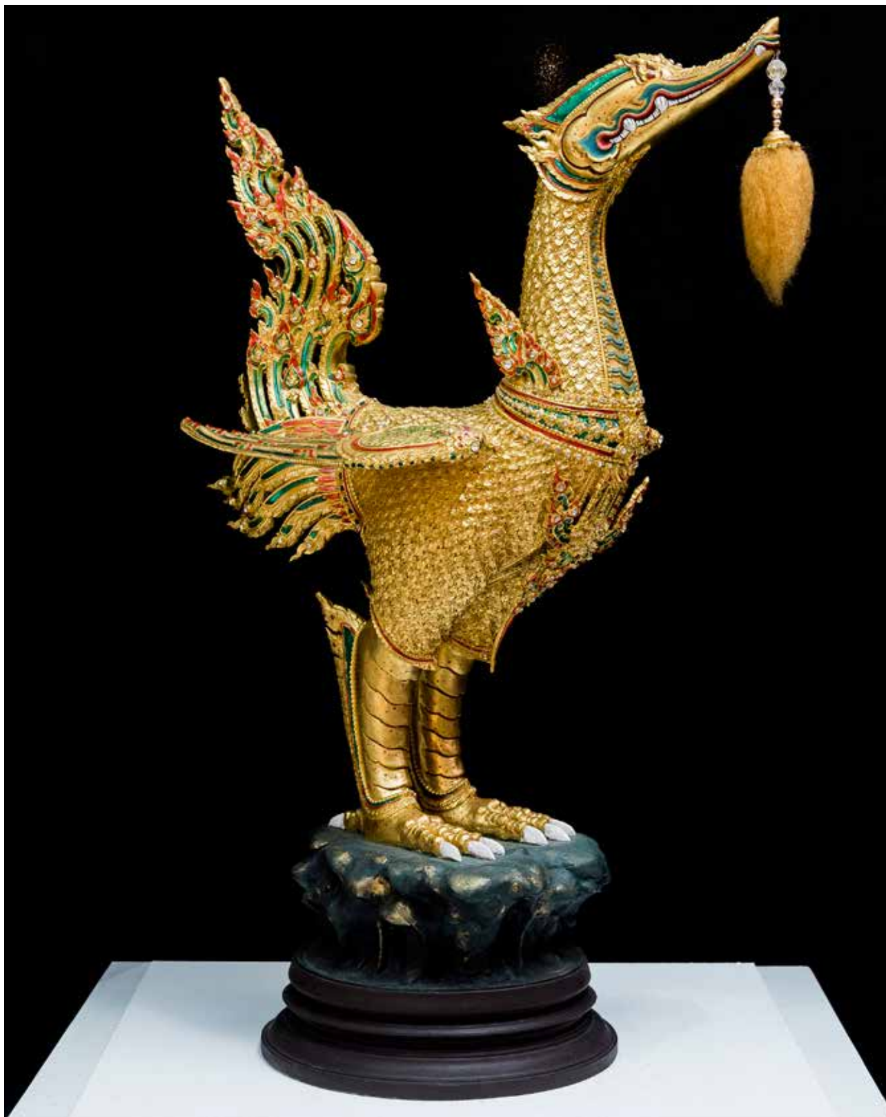
数据来源和编辑时所使用的参考资料 萨喃.拉达那老师提供的资料