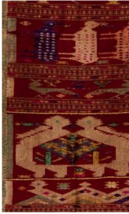
ลวดลายบนผืนผ้ากั๊ว