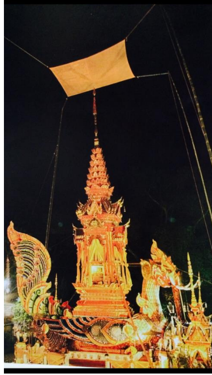
การชิงผ้ากั๋งอยู่เหนือบนยอดสุดของปราสาทศพ

นอกจากนั้น "ผ้ากั๋ง" ยังจะนำมาใช้เป็นผ้าที่กางกันเหนือสถานที่ฌาปนสถานหรือสถานที่จัดส่งสการปลงศพ หรือเผาศพของพระภิกษุในวัฒนธรรมล้านนา ที่มีการจัดสร้างปราสาทนกหัสติลิงค์ขึ้นเป็นการเฉพาะเพื่อใช้แทนเมรุที่เผาศพ ตามความเชื่อที่ว่า นกหัสติลิงค์นี้จะนำพาวิญญาณของผู้วายชนม์ไปสู่สุคติภพอันไกลโพ้นได้ บนยอดสุดของปราสาทใส่ศพจะผูก ผ้ากั๋ง หรือผ้าเทิงพระเจ้า กางกันไว้เหนือสุด ถือเป็น การแบ่งแยกขอบเขตของฆราวาสกับสงฆ์ออกจากกันอย่างเด็ดขาด หรืออีกนัยหนึ่งเป็นความเชื่อในเรื่องของการได้สิ้นอายุขัยภายใต้ร่มเงาผ้ากาสาหวัดร์สมดังเจตนาของสมณะเพศ จึงเชื่อว่า การชิงผ้ากั๋งอยู่เหนือบนยอดสุดของปราสาทศพ เป็นการกางกันเปลวเพลิงขณะที่ได้ทำการฌาปนกิจกลางแจ้งนั้น ไม่ให้เปลวไฟนั้นแผดเผาขึ้นไปถึงสวรรค์ชั้นพรหมได้ ผ้ากั๋ง ที่ใช้ในทางศาสนาเช่นนี้ นิยมทอขึ้นเป็นผ้าฝ้ายสีขาว หรือฝ้าย้อมสีตามแบบสีของจีวรพระสงฆ์ก็ได้ บางครั้งก็ใช้ผ้าสีอื่นๆ เช่น สีแดง สีเหลือง สีน้ำเงิน มาตกแต่งด้วยการตัดขอบ หรือใช้ลูกปัดร้อยถักเป็นตาข่ายหรืออุบะห้อยประดับโดยรอบแทนระบาย บางผืนอาจมีการตกแต่งประดับด้วยดอกหรือดวงดาวด้วยการฉลุกระดาษสีแปะประดับ อันมีความหมายถึงดาวเพดานและอนันตจักรวาลที่ปรากฏกล่าวไว้ตามพระคัมภีร์ในพระศาสนา ลักษณะโครงสร้างของผืนผ้าขึ้นอยู่กับความนิยมของแต่ละกลุ่มวัฒนธรรม และการใช้งาน ลวดลายบนผ้ากั๋งที่นิยม มีทั้งลักษณะลายเรขาคณิต และลายรูปสัตว์ในตำนานที่มีความเกี่ยวเนื่องและความเชื่อด้านศาสนา เช่น ลายช้าง ลายม้า ลายนาค เป็นต้น