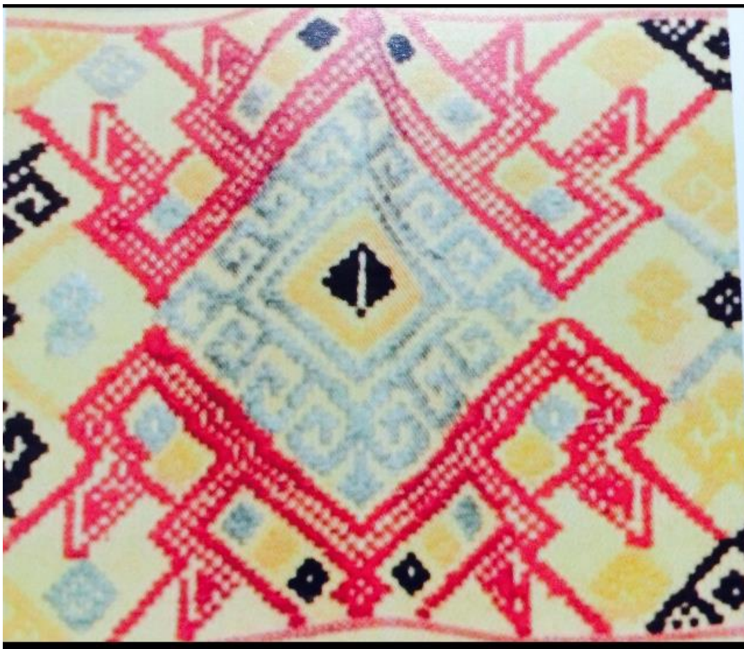
ลวดลายนาค บนพื้นผ้ากึ่ง