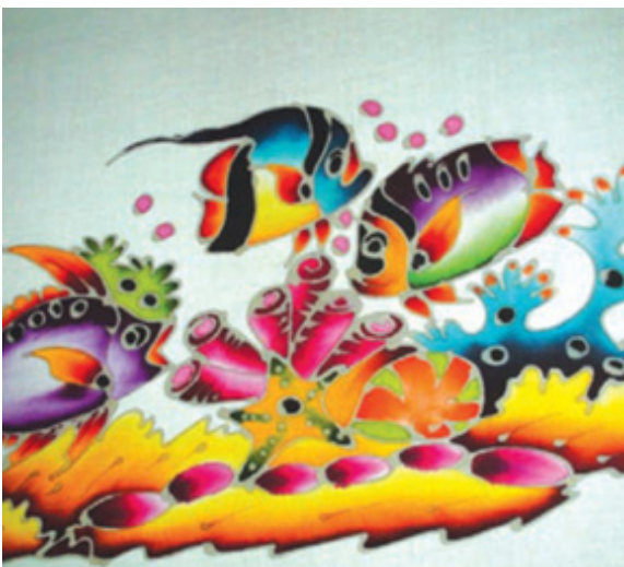
ผ้าบาติกลายท้องทะเล