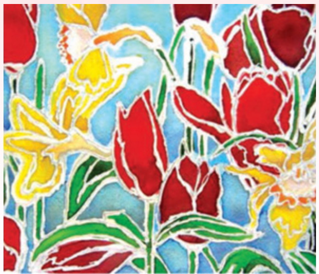
ผ้าบาติกลายดอกไม้

บาติก เป็นการออกแบบผ้าที่มีการประยุกต์ หมายความว่า การวาดระบายสีโดยใช้สีฝุ่นหรือสารชนิดอื่นๆ ที่มีลักษณะทางกายภาพเหมือนสีฝุ่น ใช้ในการรักษาสีดั้งเดิมของผ้าหรือเพื่อกันสีหรือปิดส่วนที่ไม่ต้องการให้สีติด ขณะที่ระบายสีสีลงบนผ้า ดังนั้นผ้าที่ถูกระบายสีอาจมีสีเดียวหรือหลายสีก็ได้ อยู่ในความต้องการของผู้ออกแบบ เทคนิคการทำผ้าบาติกนั้นมีหลายวิธีการ แต่ละเทคนิคจะขึ้นอยู่กับความต้องการในการสร้างลวดลาย รูปแบบที่แตกต่าง การตอบสนองความต้องการในแง่ของประโยชน์ใช้สอยและความงาม