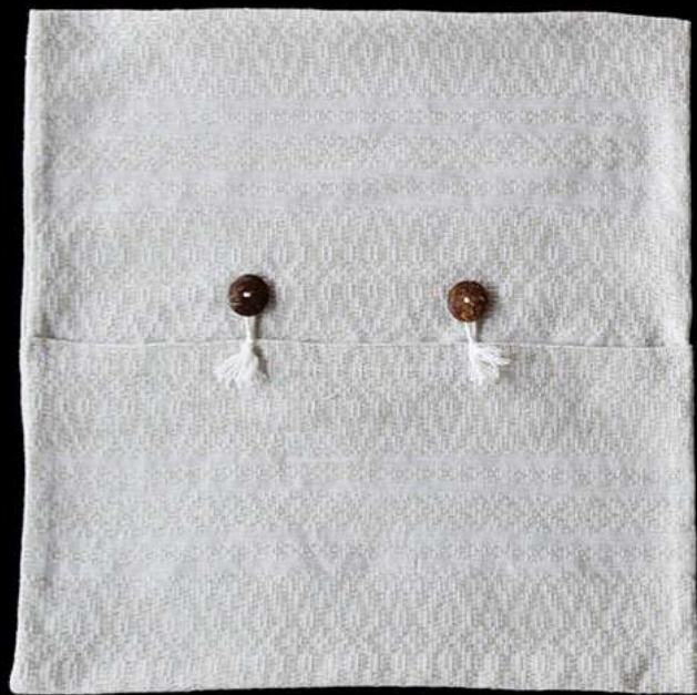
ปลอกหมอนย้อมสีธรรมชาติ