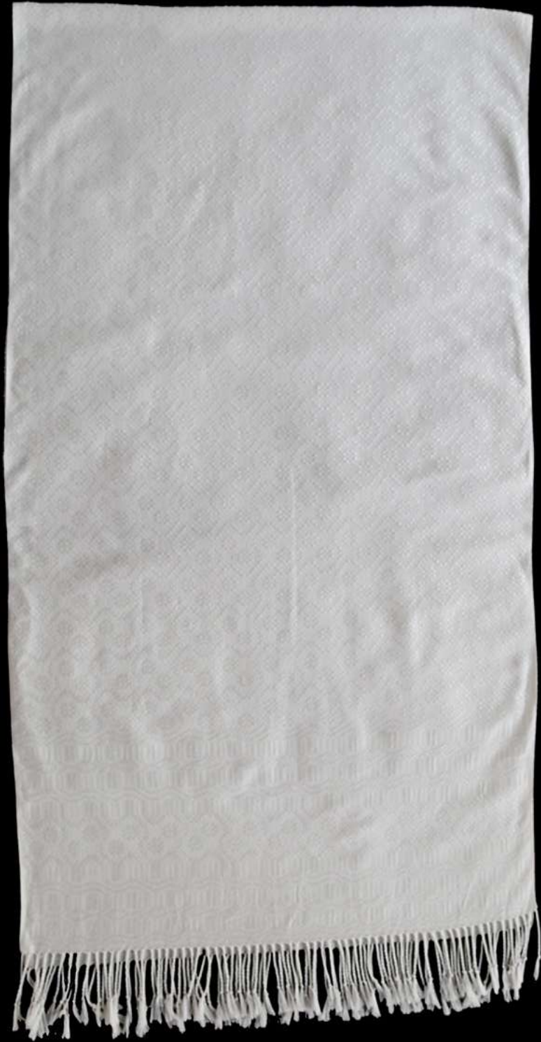
ผ้าฝ้ายย้อมสีธรรมชาติ