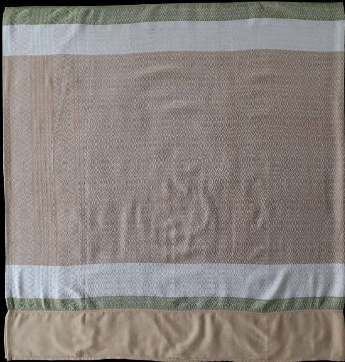
ผ้าฝ้ายย้อมสีธรรมชาติ