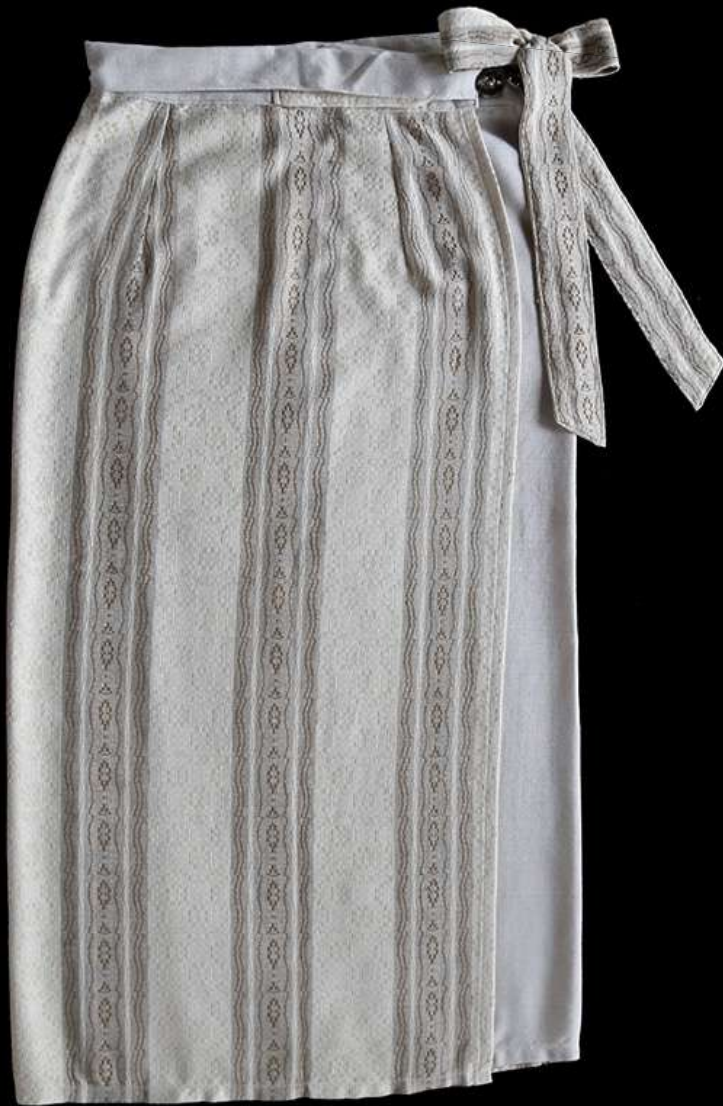
ชุดเสื้อและกระโปรงย้อมสีธรรมชาติ