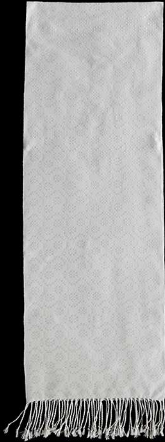
ผ้าฝ้ายย้อมสีธรรมชาติ