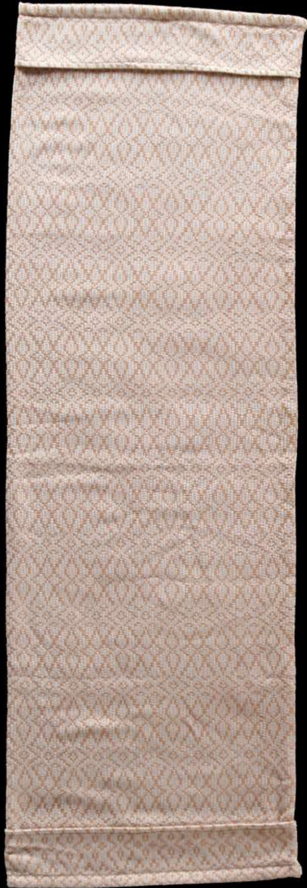
ผ้าฝ้ายย้อมสีธรรมชาติ