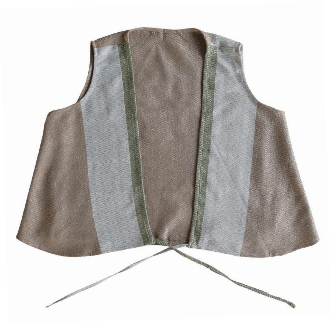
เสื้อย้อมสีธรรมชาติ