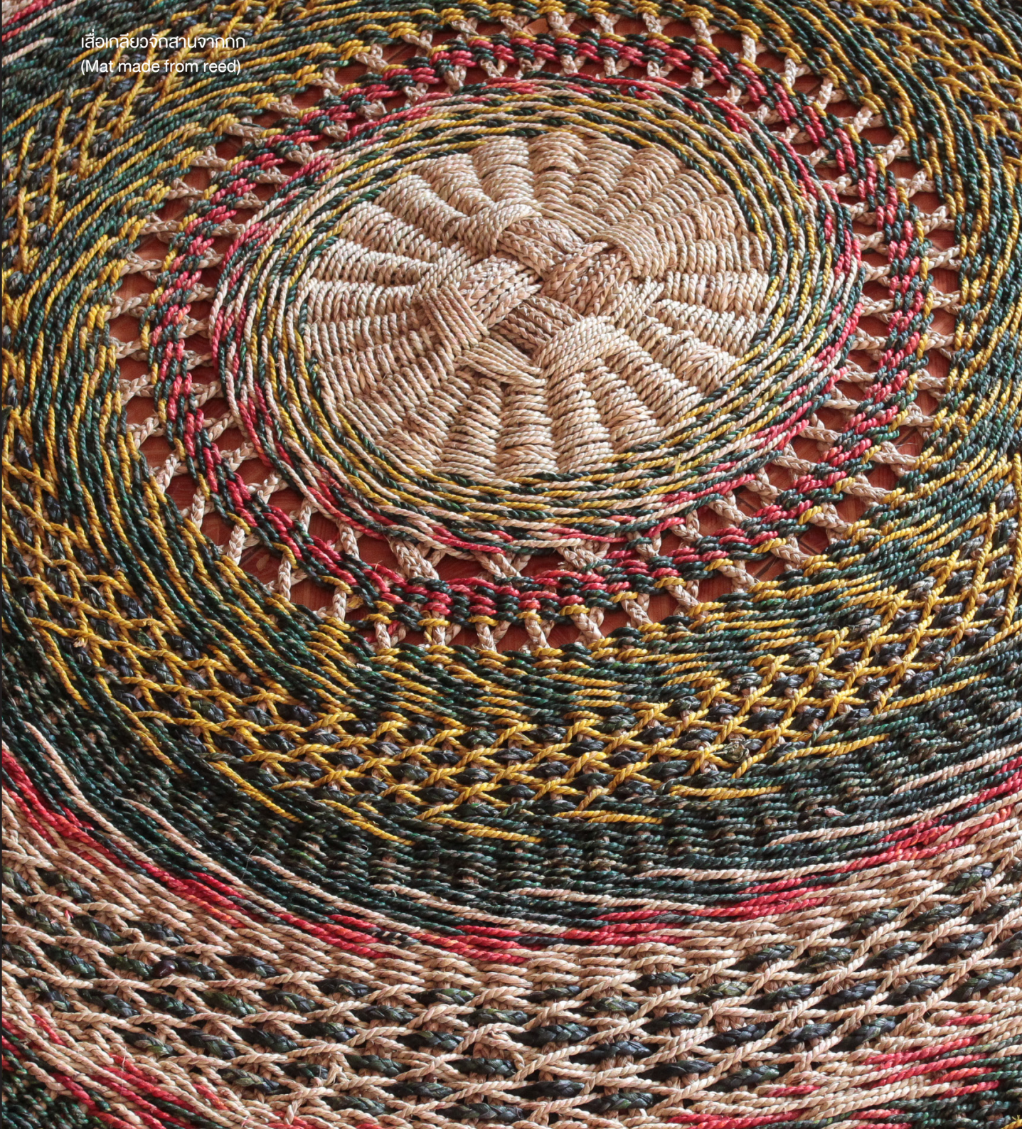
เสื่อทอด้วยวัสดุจากกก (Mat made from reed)