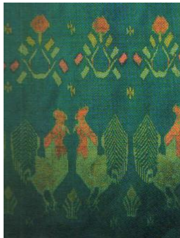
ลวดลายไก่คู่สลับต้นสน