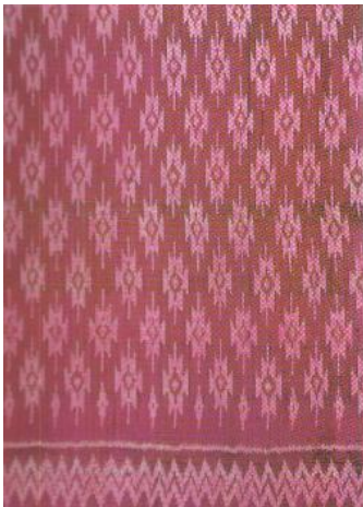
ลวดลายดอกแก้ว

คำว่า “มัดหมี่” เป็นลักษณะของการประดิษฐ์ลวดลายให้เกิดบนผืนผ้า ด้วยเทคนิควิธีการใช้เชือกมัดเส้นไหม หรือฝ้ายส่วนที่ไม่ต้องการให้ติดสีเวลาย้อมเป็นเปลาะ หลังจากการย้อมแล้วเมื่อตัดเส้นเชือกที่มัดออก จึงเกิดลวดลายตามต้องการ