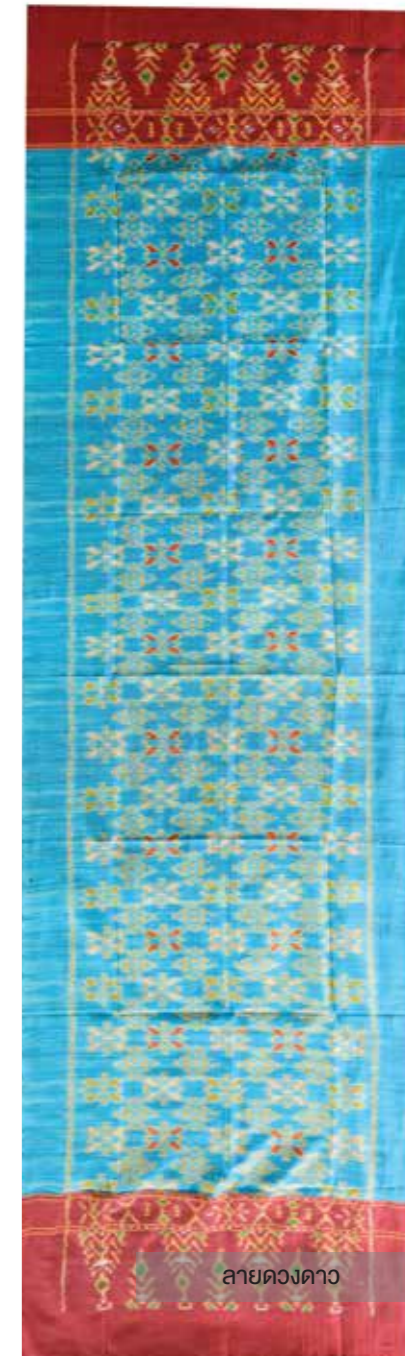
ลายดวงดาว

“ เด็กสมัยใหม่ไม่ค่อยสนใจ ถ้าคุณไหนสนใจ จะสอนให้ฟรี อยากรักษาภูมิปัญญา ให้คงอยู่ตลอดไป ”