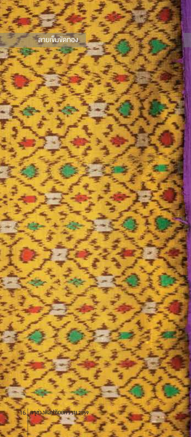
ลายเข็มขัดทอง